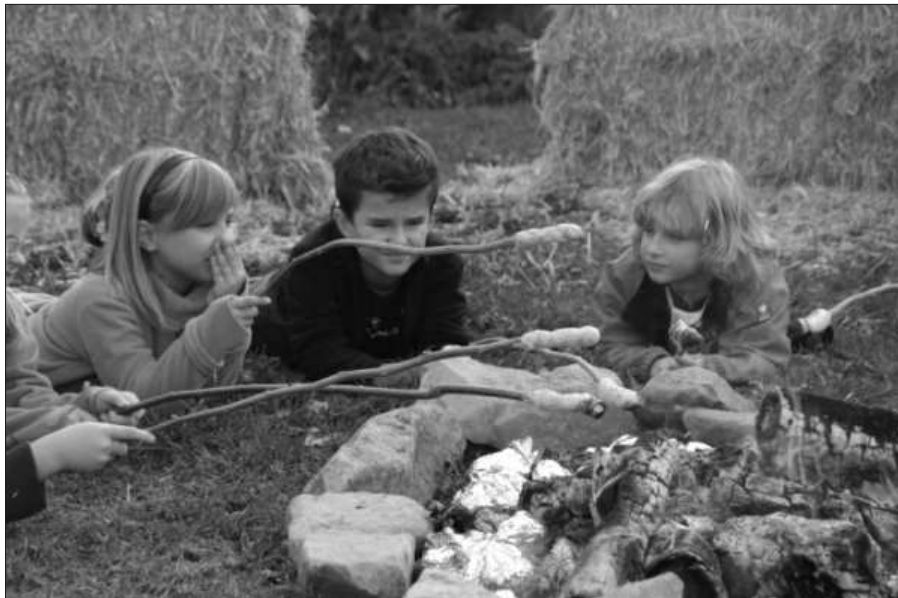
Kartoffelfeuer der kleinen Jungschar - 21. September 2012