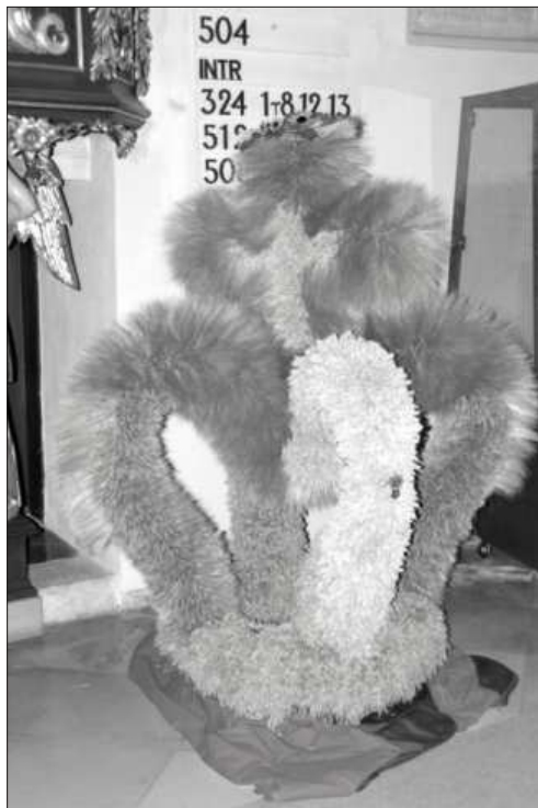
ERNTEKRONE in der St. Jakobuskirche Berg gebunden von der Landjugend Zedtwitz