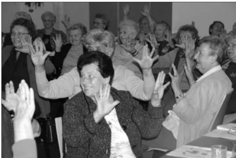
Fröhlicher Seniorennachmittag - 25. September 2012